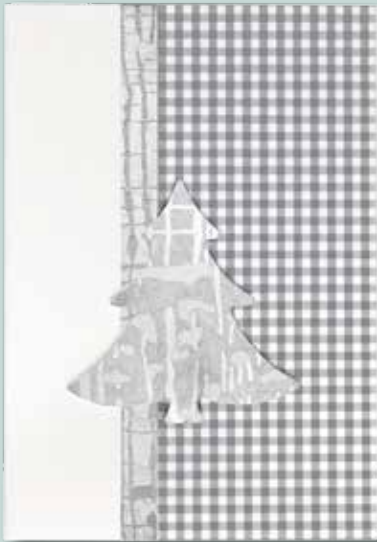
Art. Nr. 2015-04 Weihnachtskarte silber/weiß, mit Applikation Tanne, Format DIN A 6 hoch, inkl. Umschlag