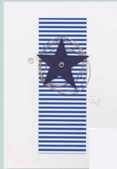
Art. Nr. 2015-07 Weihnachtskarte blau/weiß, mit Applikationen, Format DIN A 6 hoch, inkl. Umschlag