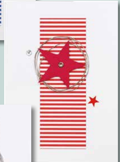
Art. Nr. 2015-08 Weihnachtskarte rot/weiß, mit Applikationen, Format DIN A 6 hoch, inkl. Umschlag