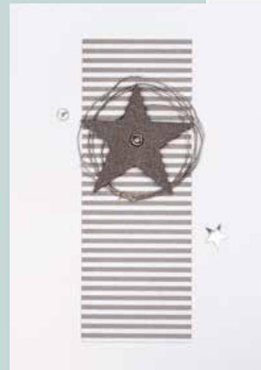
Art. Nr. 2015-09 Weihnachtskarte silber/weiß, mit Applikationen, Format DIN A 6 hoch, inkl. Umschlag